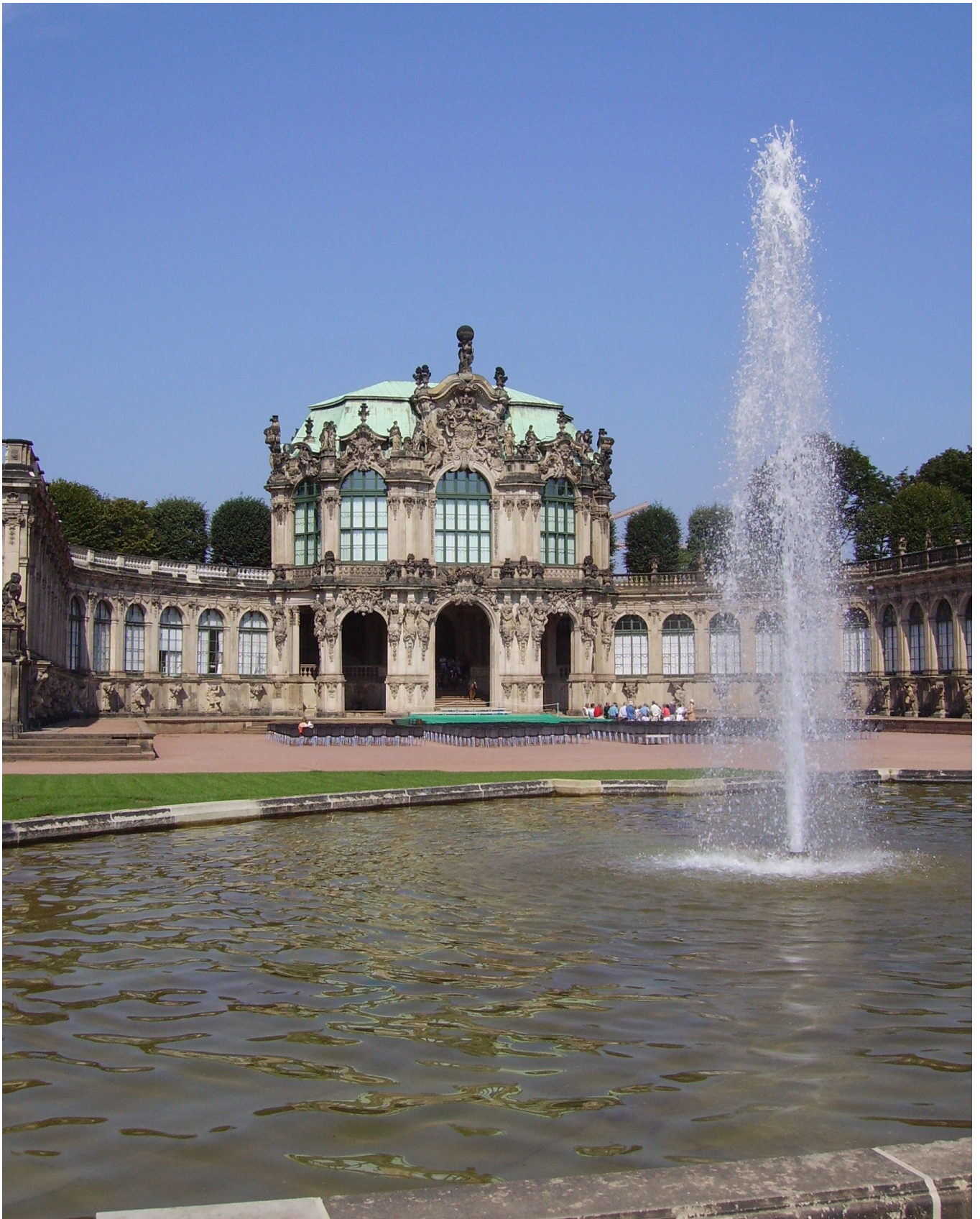
13. Dresden (Alemania) desde Praga 🚗 🚦